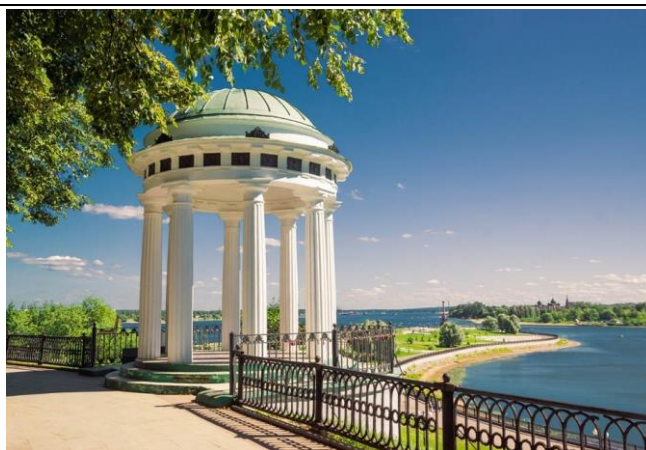
Волжская набережная г. Ярославля