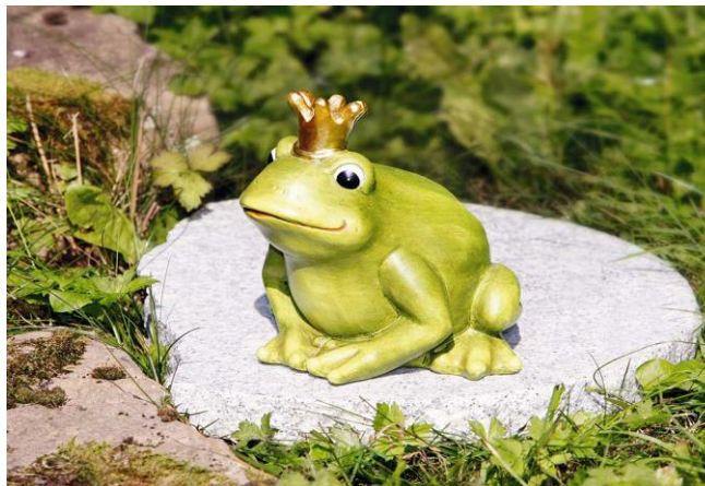
«Музей царевны лягушки»