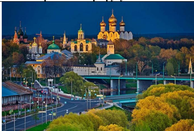
Панорама г. Ярославля