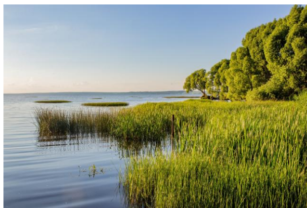
Национальный парк «Плещеево озеро»