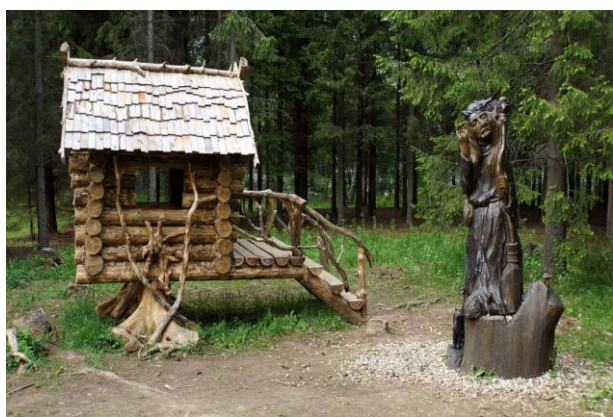
Дендрологический сад им. С.Ф. Харитонова. Тропа сказок