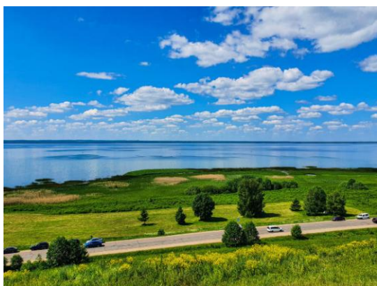
Национальный парк «Плещеево озеро»