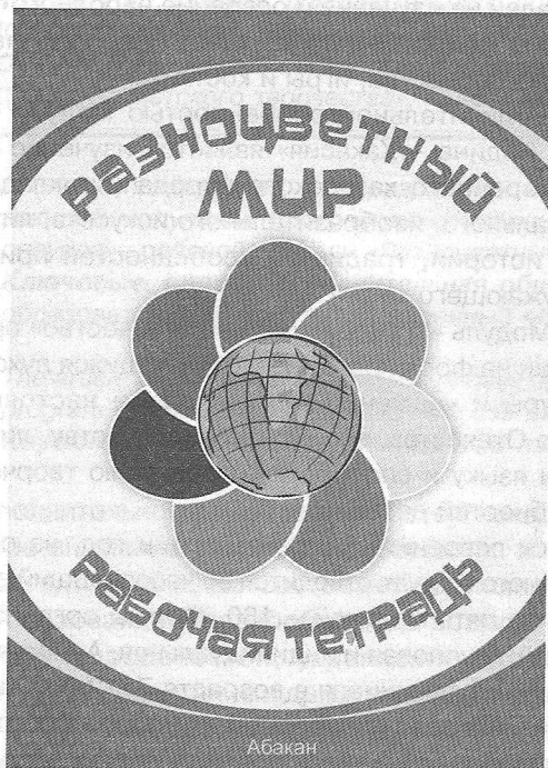
Рис. 1. Титульный лист

Форма электронного образовательного ресурса способствует повышению уровня мотивации у обучающихся к получению дополнительных знаний и закреплению имеющихся при выполнении соответствующих практических заданий на компьютере.