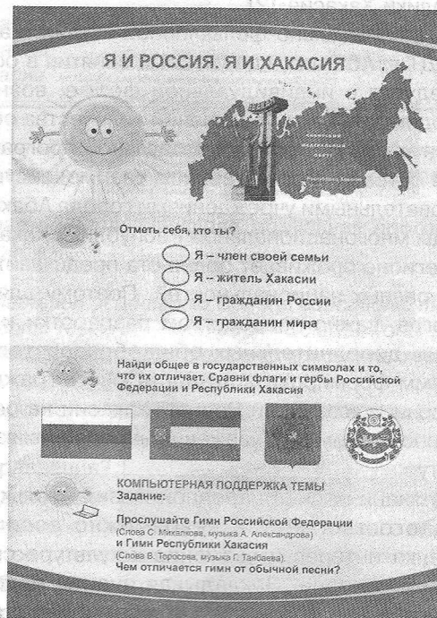
Рис. 2. Первый лист раздела «Я и Россия. Я и Хакасия»