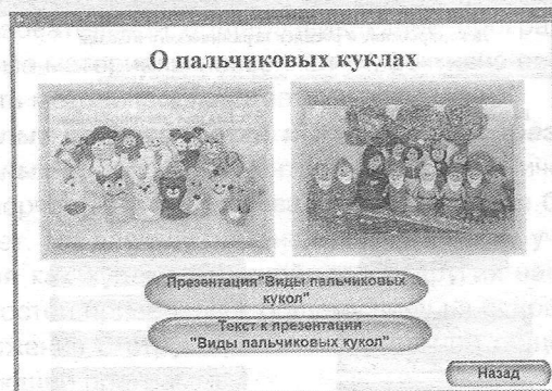
Рис. 6. Страница с материалами для проведения занятия

Использование электронных образовательных ресурсов в учебном процессе – это попытка предложить один из путей, позволяющих интенсифицировать учебный процесс, оптимизировать его, поднять интерес обучающихся к изучению предмета, реализовать идеи развивающего обучения, повысить темп, увеличить объём самостоятельной работы.