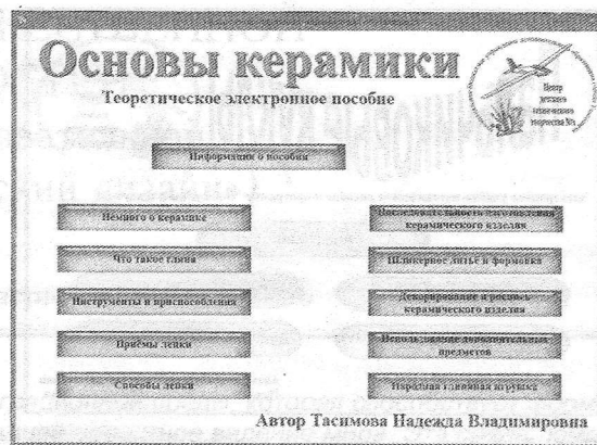
Рис. 1. Темы электронного пособия «Основы керамики»