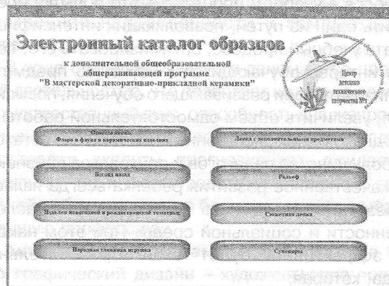
Рис. 3. Темы электронного пособия «Электронный каталог образцов»