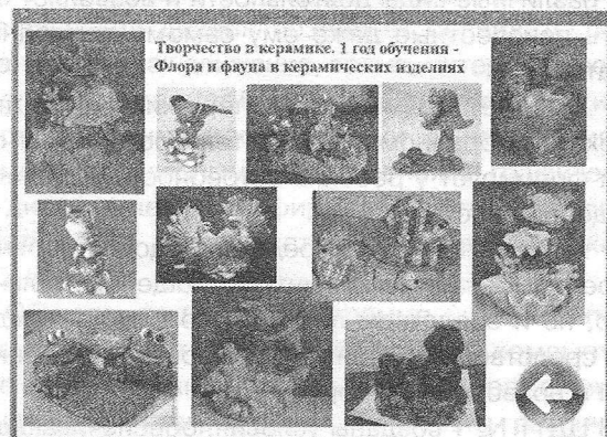
Рис. 4. Страница с картинками идей для работы